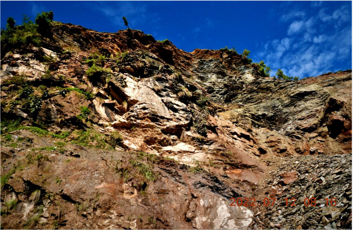
पहिरो जानु अघि छोडिएको गुड भएको स्थान