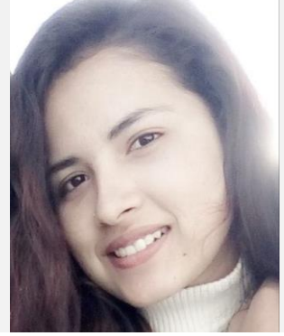
संकलन : वर्षा अधिकारी

एउटा सानो पोखरी थियो । पोखरी जङ्गलको किनारमा थियो । त्यहाँ धेरै रङ्गिचङ्गि माछाहरु बस्दथे । त्यस पोखरीमा एउटा कछुवा पनी बस्दथ्यो । पोखरीको किनारमा रुखमा बस्ने लाटोकोसेरोसंग उसको मित्र थियो । दुबै साथि घण्टौसम्म गफ गर्दै बस्थे । यसरी हाँस्दै खेल्दै उनीहरुको दिनचर्या रमाइलो सगँ बित्दै थियो ।