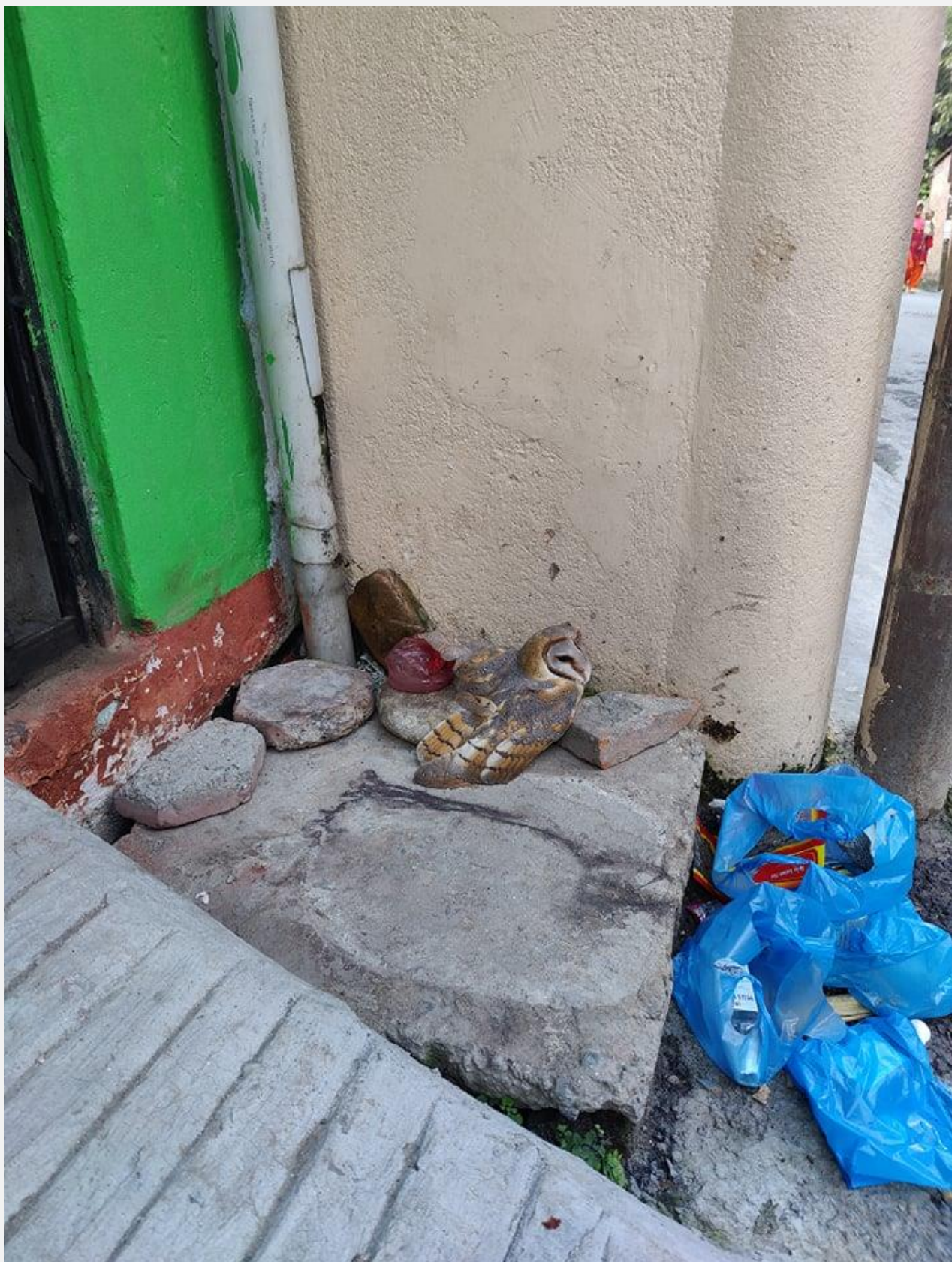
जुलाई १४, २०२२ मा काठमाडौं गौशालामा घाइते अवस्थामा भेटिएको गोठे लाटोकोसेरो सकुशल आफै प्राकृतिक वासस्थानमा फर्किएको छ । तर नउड्ने बेलासम्म कुकुर तथा मानिसहरुलाई नजिक आउन रोकिएको थियो।