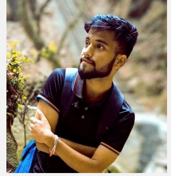
संकलन : दुर्लभ पराजुली

हामी सबैले सपना देखे गरेका छौं जुन स्वभाबिक प्राकृतिक प्रक्रिया हो । सपनाले मानिसको मनोवैज्ञानिक एवं सामाजिक जीवनका विविध पक्षमा प्रभाव पार्दछ। स्वप्न फल तयार गर्दा प्राचीन समय देखि चलिआएका मान्यता र तिनीहरूको मनोवैज्ञानिक विश्लेषणलाई आधार मानिएको छ ।नेपाल लगायत विभिन्न मुलुकमा सपनामा देखिने लाटोकोसेरोलाई लिएर विभिन्न जनविश्वास रहेको पाइएको छ।