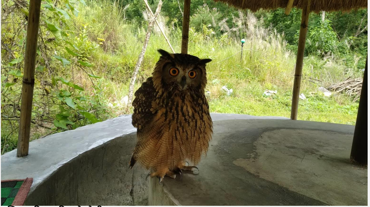
तस्बिर: नविन लामिछाने (बेशीसहर लमजुङ )