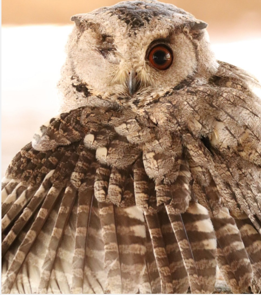
झापा जिल्लामा भेटिएको घाइते लाटोकोसेरो प्राकृतिक वासस्थानमा फर्केको छ