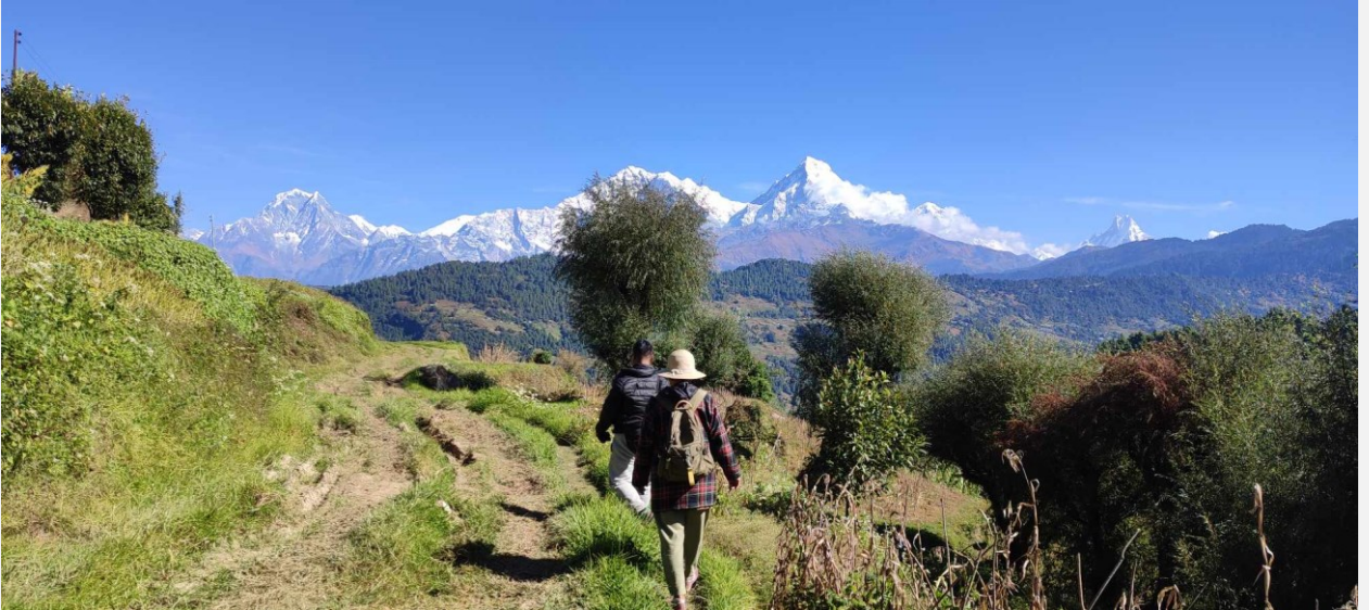
यसपालिको लाटोकोसेरो उत्सव हुने लोप्रे गाउँ

मानिसलाई दुख नदिने तर मुसाको सङ्ख्या नियन्त्रण गरेर किसानलाई सहयोग गर्ने यो चरालाई किसानको साथी पनि भनिन्छ । यिनको चोरी सिकारी र अवैध व्यापार नियन्त्रणको लागि यो उत्सव हुने गरेको छ । नेपाल समेत यो उत्सव अमेरिका, इटाली र भारतमा पनि हुने गरेको छ।