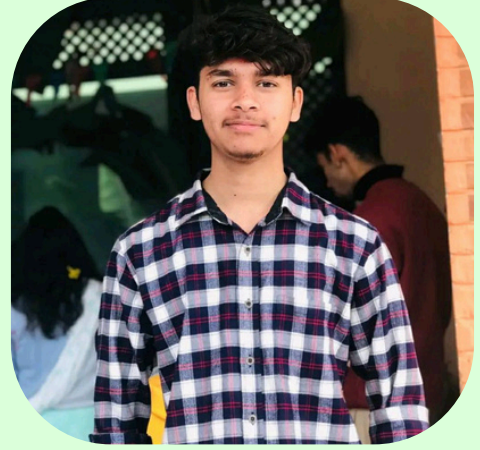
सुगम गुरागाई वन विज्ञान अध्ययन संस्थान, हेटौडा

ज्येष्ठ ४, २०८१। दिउसो ४ बजे तिर हेटौडा उपमहानगरपालिका वडा नं ९ सिमेन्ट रोडमा हिँड्दै थिएँ। अन्दाजी १० वर्षीय बालक हातमा चरा लिएर हिँडे जस्तो लाग्यो। नजिक पुगे पछि थाहा भयो यो लाटोकोसेरो थियो।