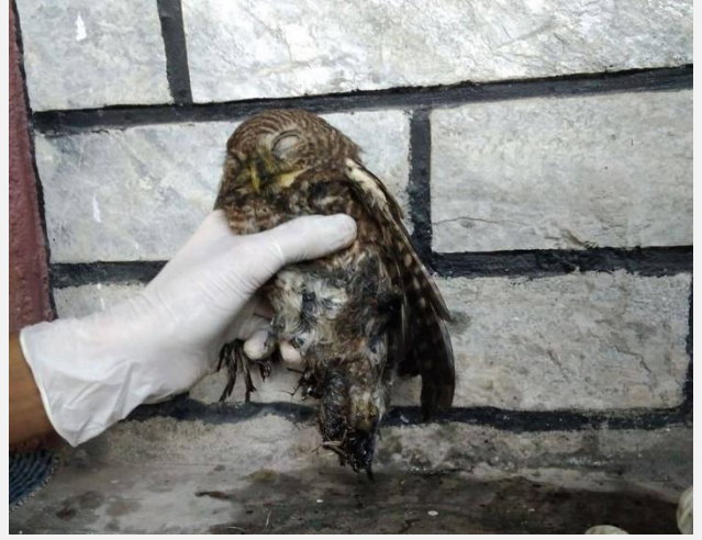
लाटोकासेरोलाई सफा गर्ने क्रममा