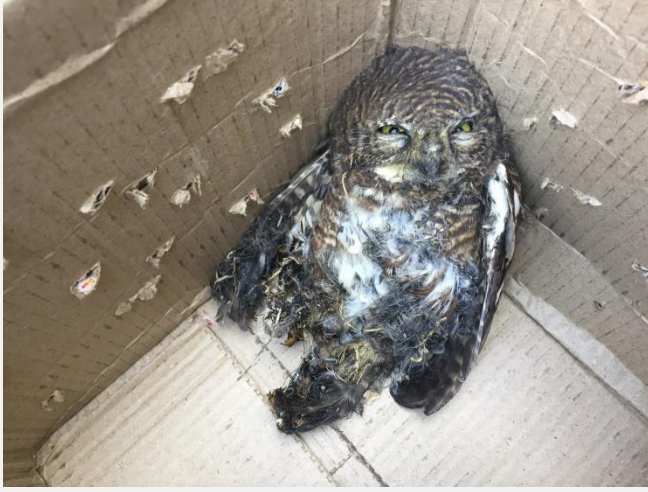
लाटोकासेरो सफा गर्नु अघि