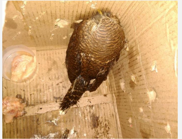
सफा गरे पछि लाटोकासेरो आराम गर्दै तस्विरहरु :ऋषि बराल